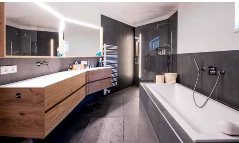
Effekt durch punktgenaue Beleuchtung und Elektroinstallationen der Firma Elektro Volderauer.