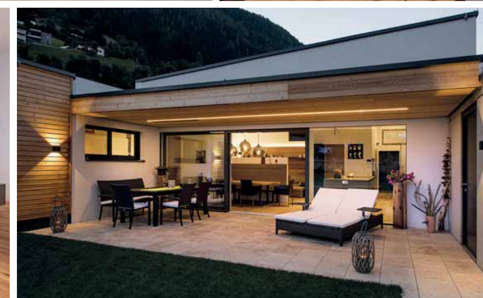
Von allen Seiten ein anderes Profil: Für das neue Haus lieferte das Möbelstudio Spechtenhauser Küche und Möblierung.